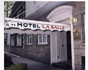
HOTEL LA SALLE