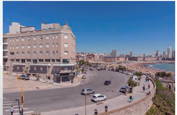
HOTEL PUNTA PIEDRAS